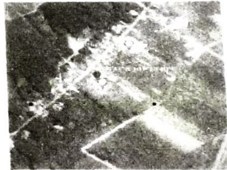
สนามกีฬาบ้านกวนเสีรา