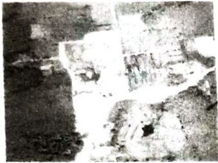
สนามกีฬา อบต.กอลำ