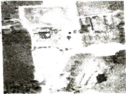
สนามหญ้าเทียม อบต.กอลำ