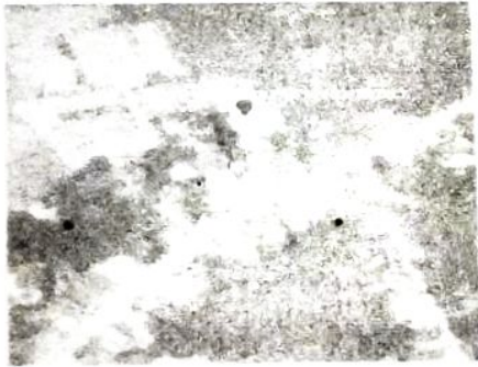
สนามกีฬาบ้านสะดา