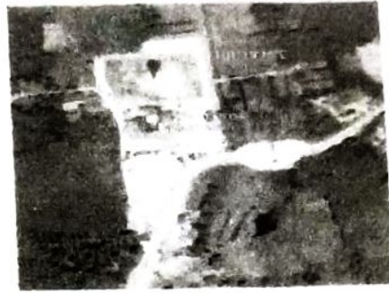
สนามกีฬาากลาง อบต.กอลำ