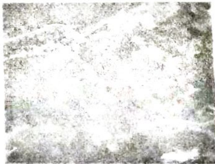
สนามกีฬาบ้านลานควาย